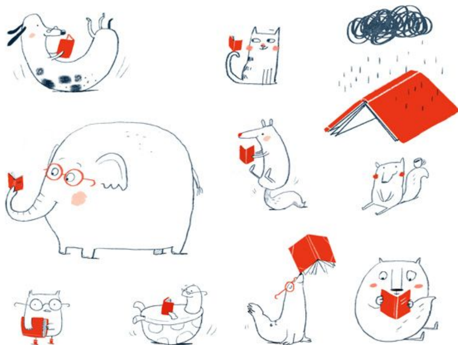
Ilustração de Ina Hattenauer